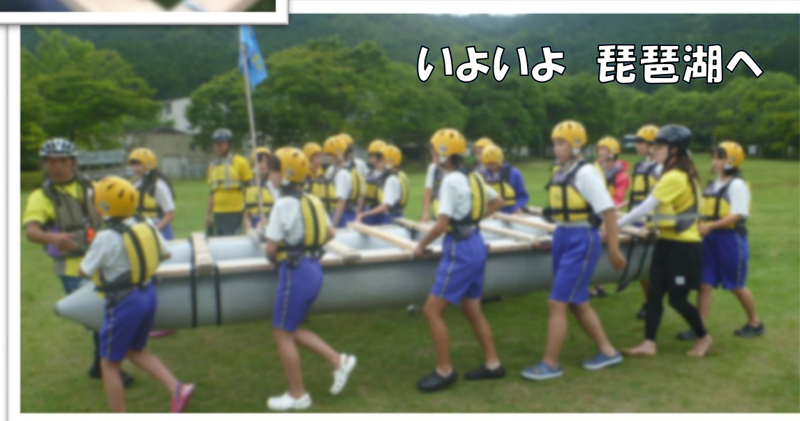
いよいよ 琵琶湖へ

雨がパラつく中の、いかだ作り。 インストラクターの人たちからは、思わず「早いな・・・」との言葉が口に出るくらい、みんなで協力していかだを作ることができました。 その行動が天気を好転させたのか、心配していた天気も、カッパを着たのはいかだを作っている時だけやったね。