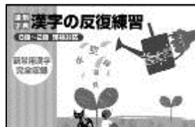
漢字ドリル 「漢字の反復練習」