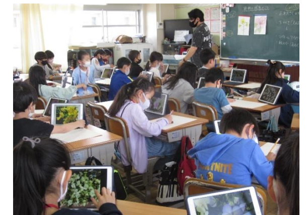
4年図工 各自で撮影した花をスケッチ