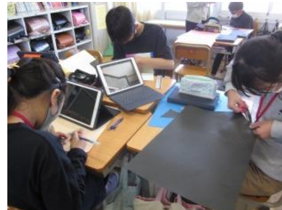
6年図工 グループで検索しイメージづくり題材を撮影し活用