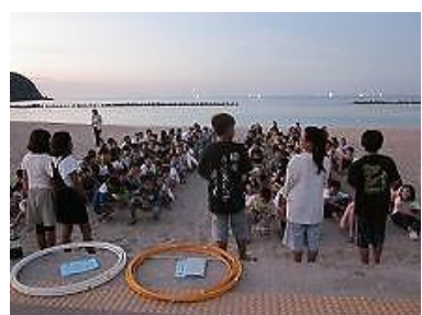
夕食後はレクタイム