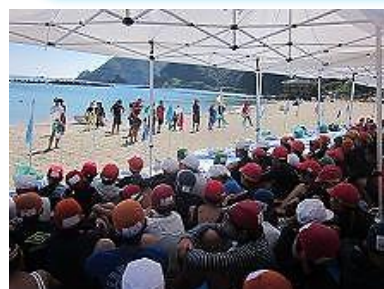
開講式はテントの中で

かたやま公民館こども祭り 8月19日(日)～かたやま公民館～ 両行事の開催にご尽力されました地域の皆様、有難うございました。