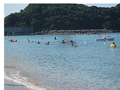
さあ、遠泳! どの子どもたちもいい顔で泳ぎました