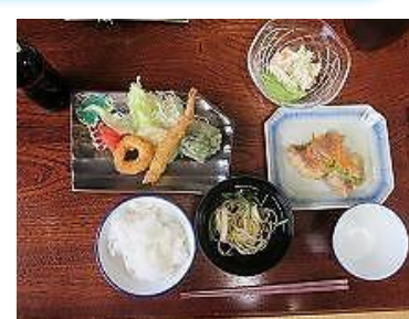
夕食、おいしかったね