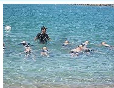
遠泳に向け、水慣れ中