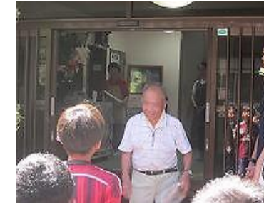
宿の皆様、ありがとうございました