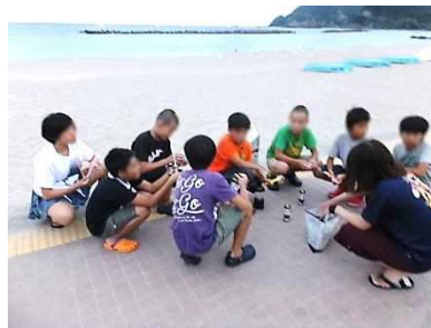
夜の集いの打ち合わせ中。