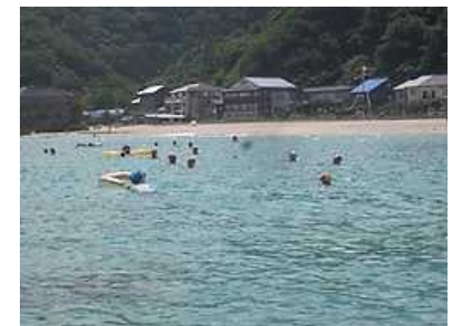
さあ、遠泳!「エーンヤコーラ」