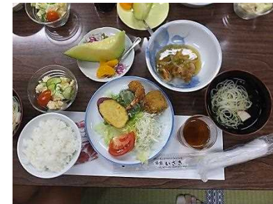
「夕食、おいしかったあ」