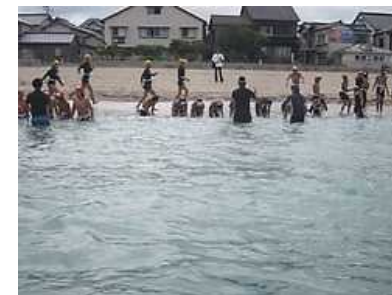
水慣れをして、海水と仲良く。