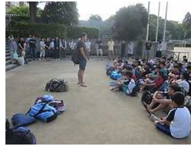
出発式 いざ竹野浜へ!

7月21, 22日の1泊2日、6年生120名と教職員で、兵庫県豊岡市竹野町へ臨海学習に行ってきました。2日間とも天候に恵まれ、予定通りのスケジュールを終えることができました。