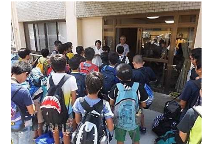
2日間お世話になりました。