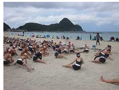
準備運動はしっかりと!