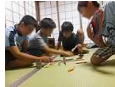
ちょっと一休憩・・・