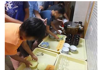
片付けもていねいに。