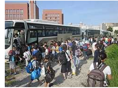
バス4台で「行ってきま〜す」