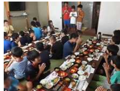
手をあわせて、「いただきます」