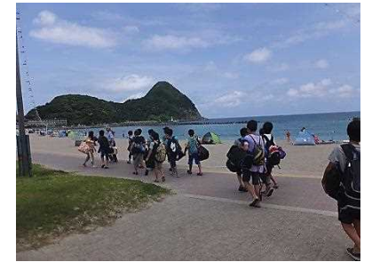
竹野浜到着。「きれいな海!」